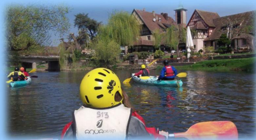
Auberge de l'Ill à Illhaeusern