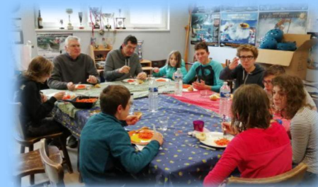
Auberge BSPM à Molsheim

A part une météo peu clémente, la semaine s'est très bien passée et l'ambiance chaleureuse a permis de réchauffer nos membres engourdis par le froid.