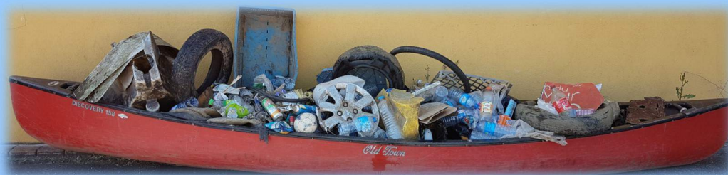
Déchets ramassés soit 15 sacs de 100 litres !!!!

Par ce geste c'est aussi les mers et les océans que nous protégeons !